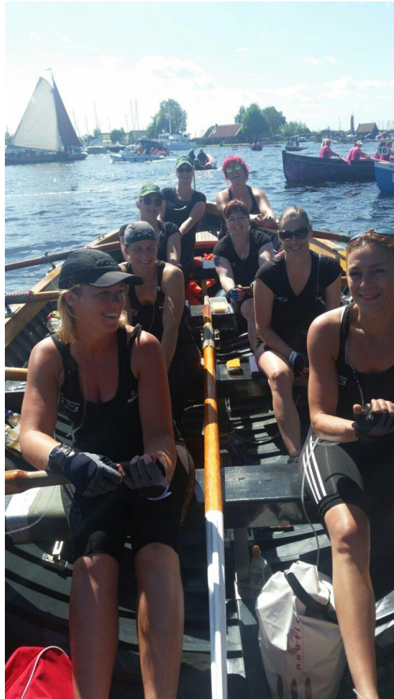
De opstelling van de Kaagrace (van boeg naar slag)