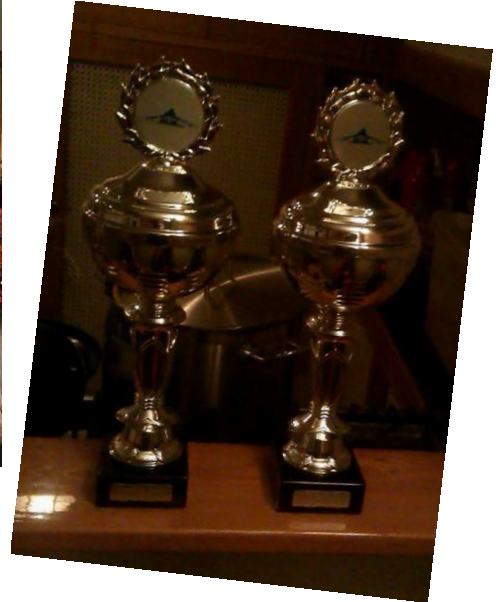
Onze bekens: trots!