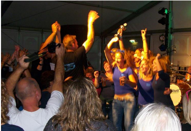
Op het podium in Muiden: tweede van heel Nederland!