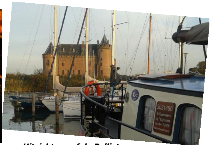
Uitzicht vanaf de Pallieter