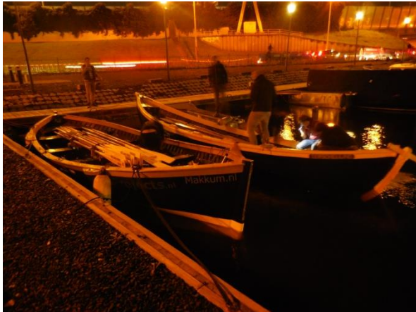
Overnachtingsplek van de Pulp Fiction

We gaan vrijdag al naar Muiden, waar onze tjalk "de Pallieter" al in de haven op ons ligt te wachten. Hier verblijven wij de komende dagen. We hebben prachtig uitzicht op het Muiderslot. De Pulp Fiction wordt gekraand en we mogen in een klein haventje aanmeren.