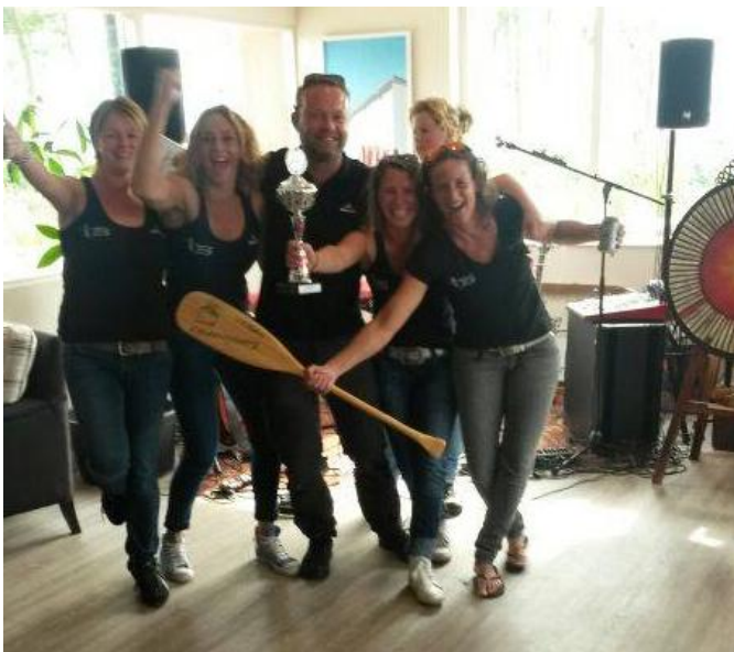
1 o prijzen

We blijven nog even lekker nagenieten. We proosten op ons succes en dansen op de live muziek in het Paviljoen.